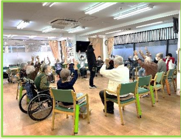
P Tと一緒に集団で機能訓練